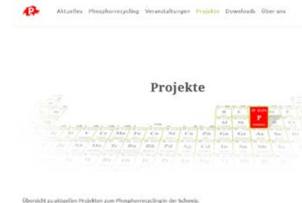
Abb: Überblick über laufende Projekte